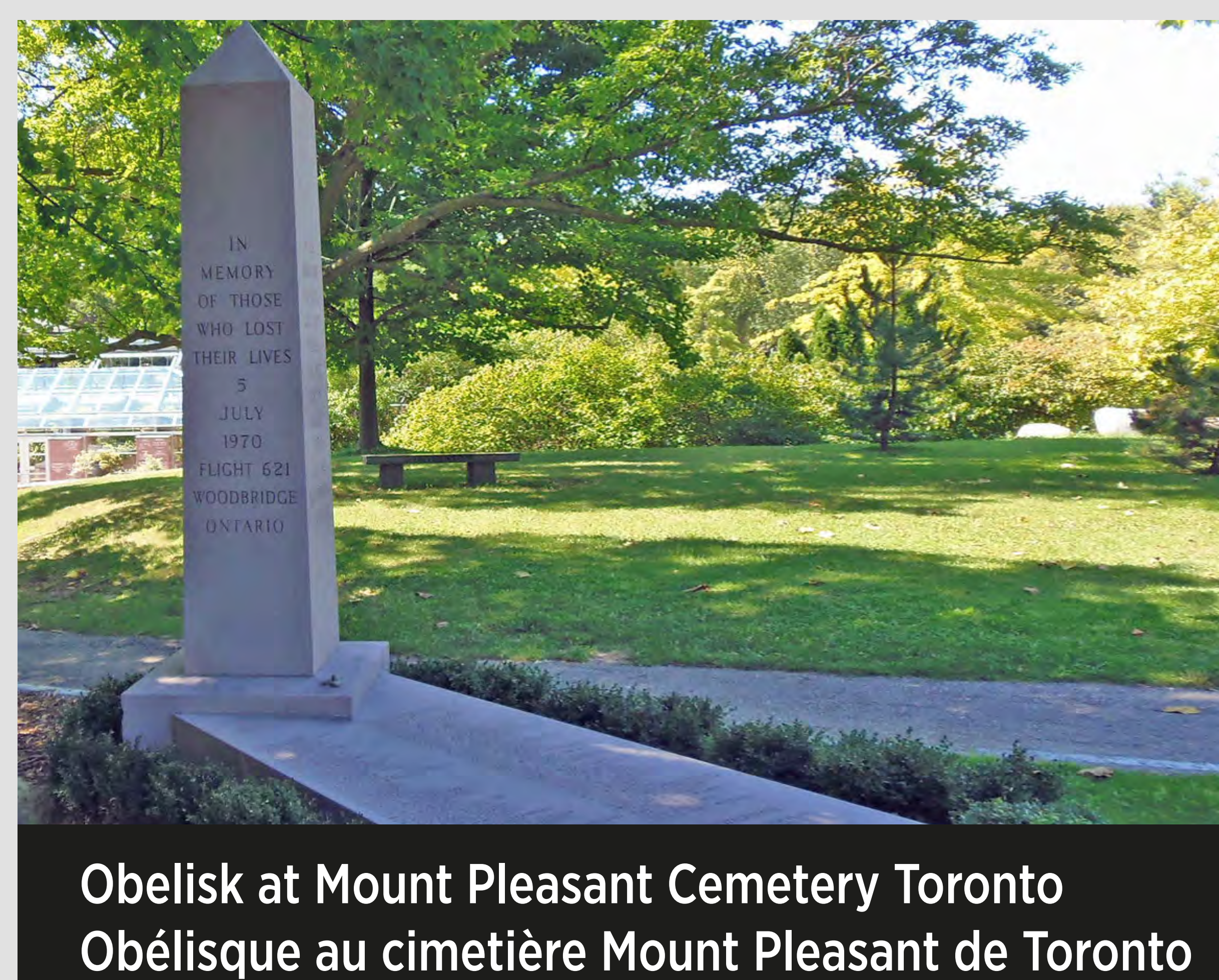
Obelisk at Mount Pleasant Cemetery Toronto Obélisque au cimetière Mount Pleasant de Toronto

« En mémoire des passagers et de l'équipage du vol 621 qui ont perdu la vie dans ce champ le 5 juillet 1970 ».